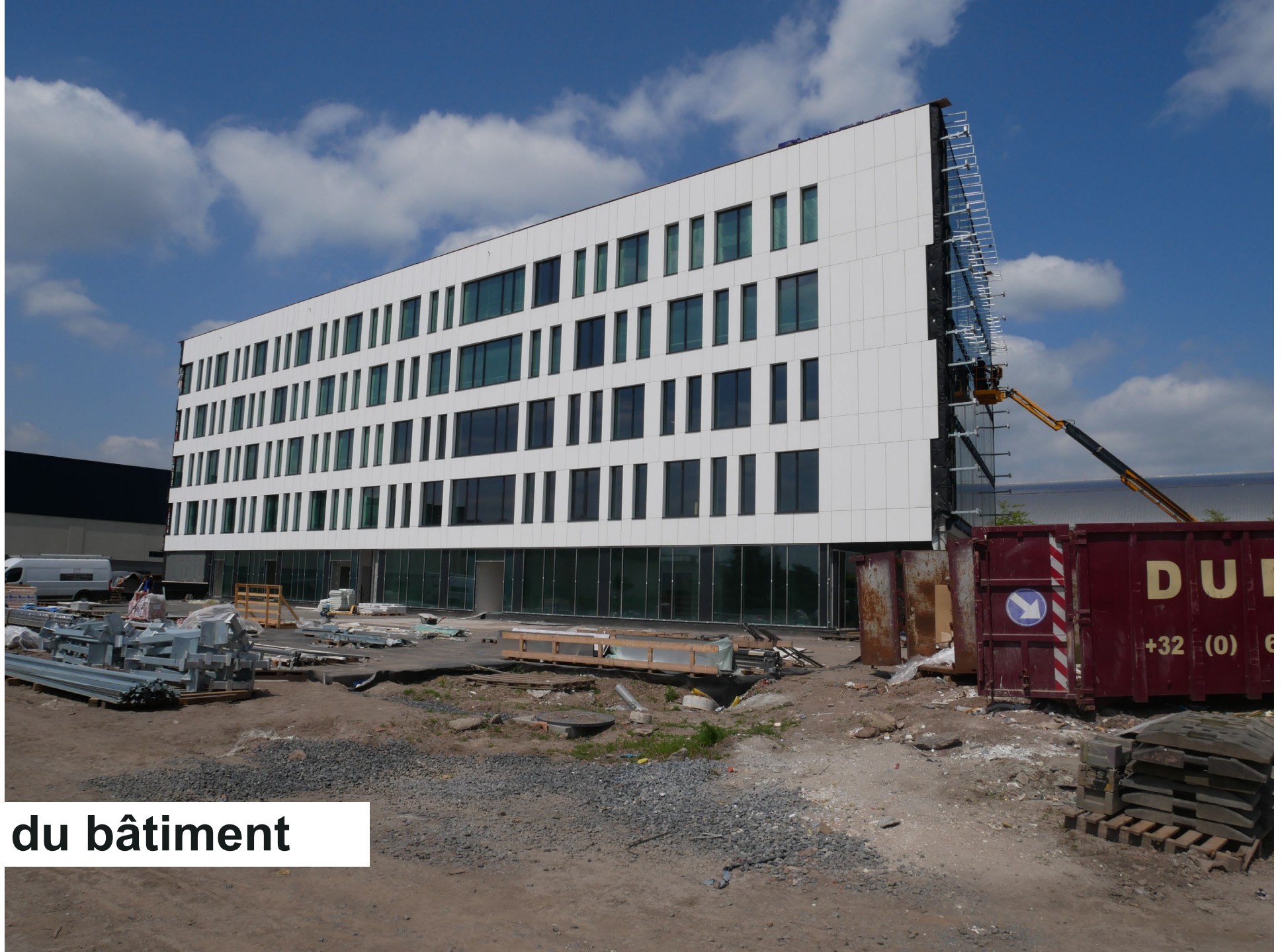
Vue arrière du bâtiment