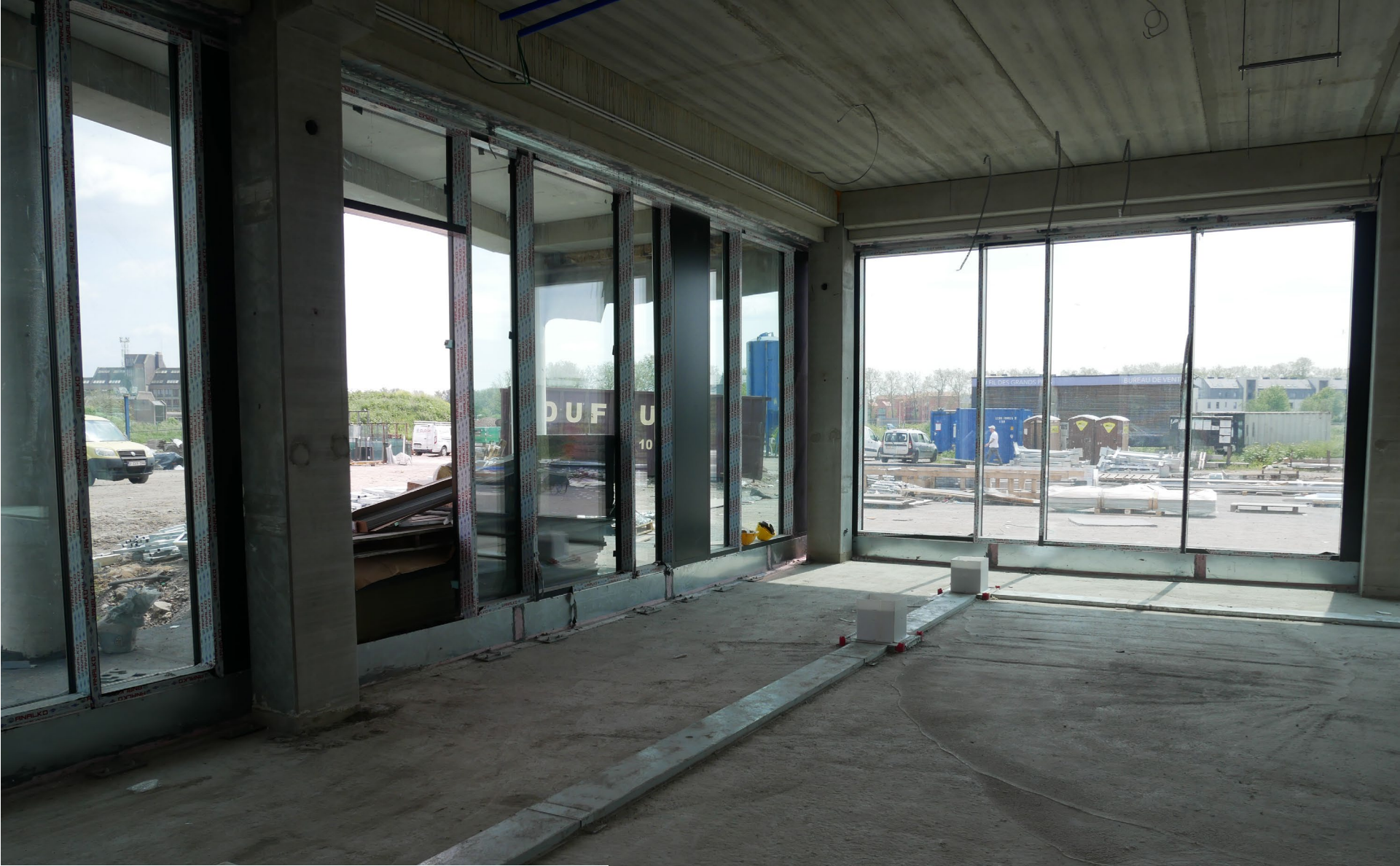
Une partie de la cafétéria