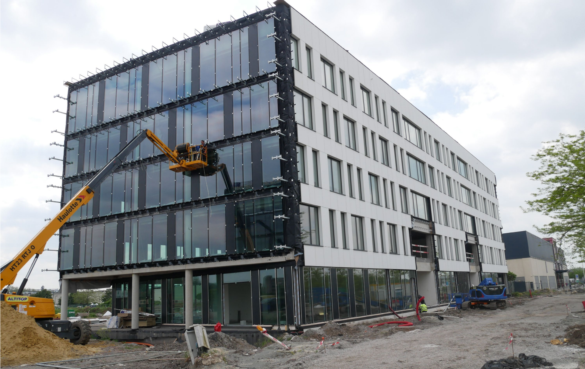
Vue avant du bâtiment