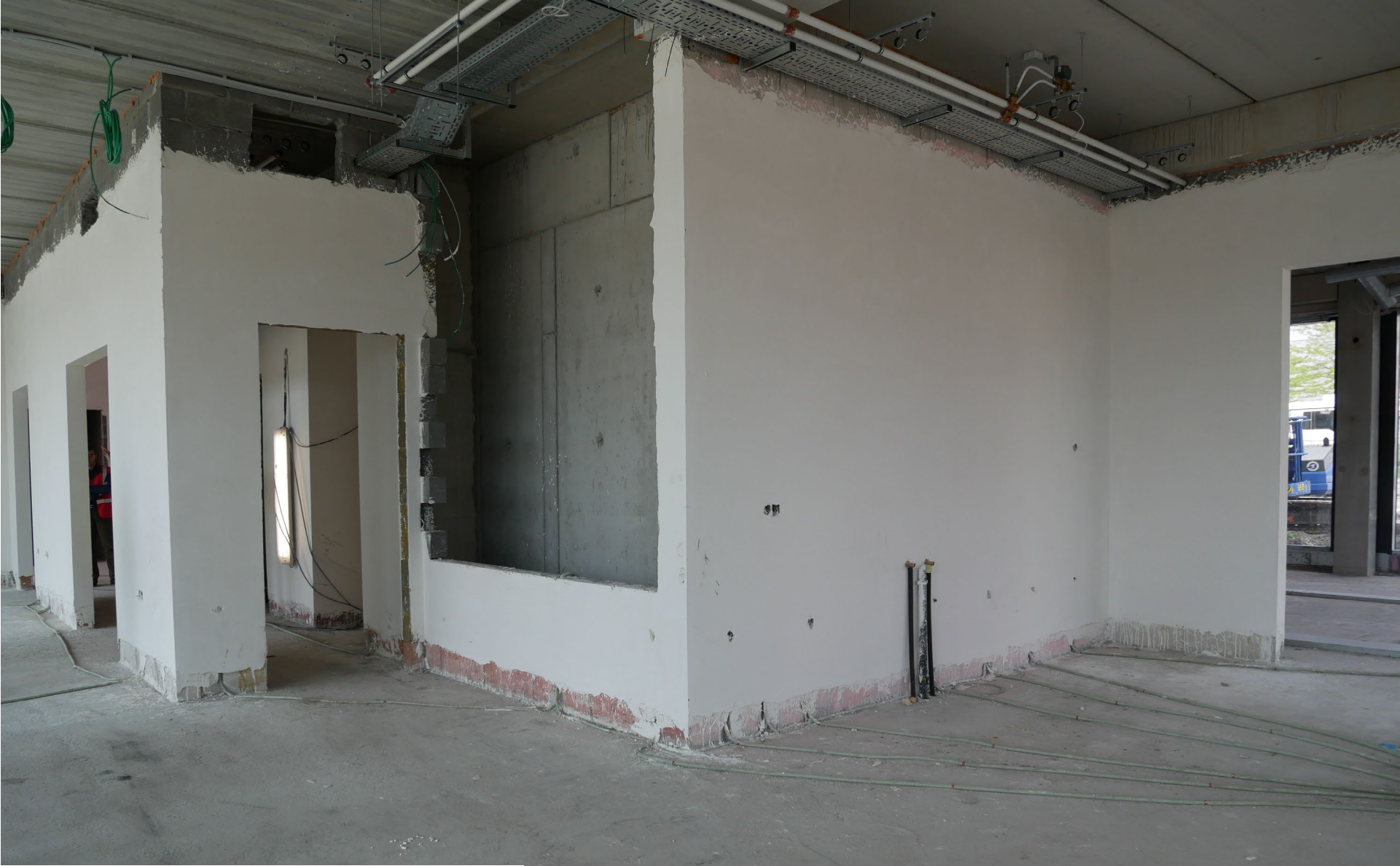
La cuisine de la caf  t  ria