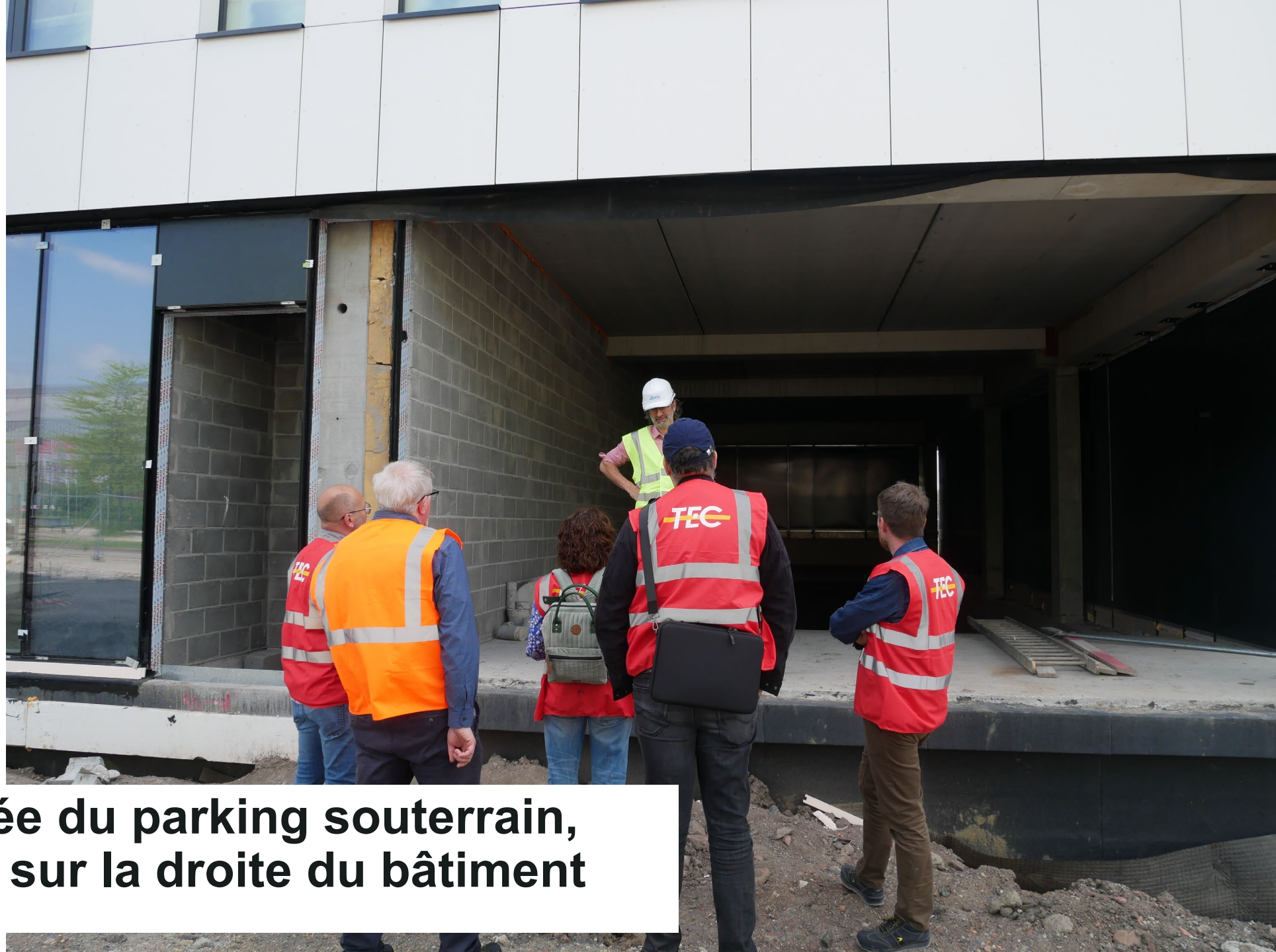
L'entrée du parking souterrain, située sur la droite du bâtiment